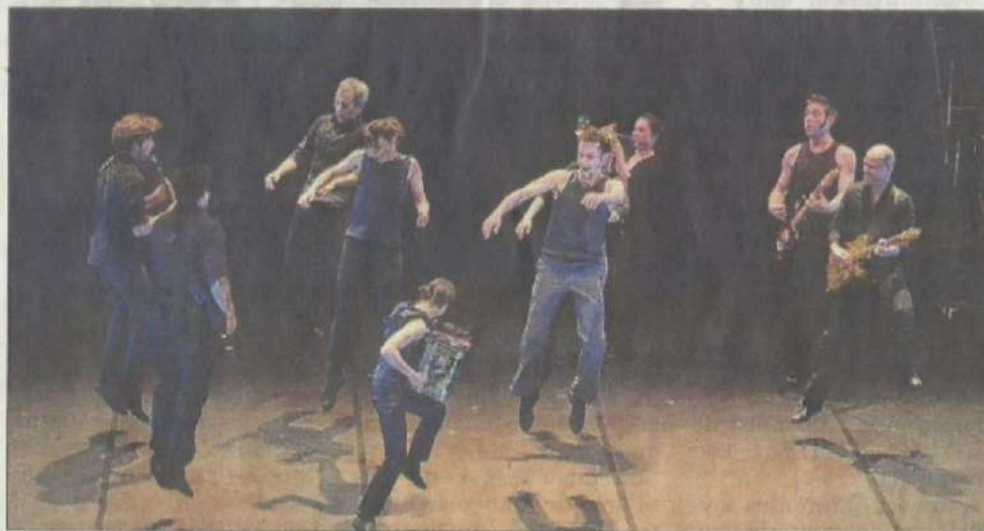
Un spectacle frais, neuf et brillant de Bruno Pradet.

THÉÂTRE DES LUCIOLES | À 20 h 45 "L'homme d'habitude"