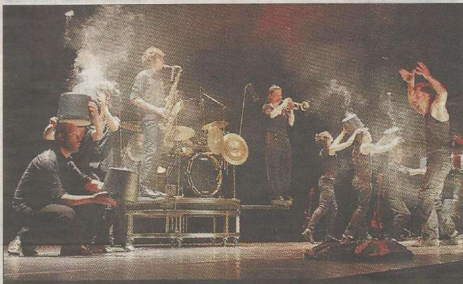
SPECTACLE. Les onze interprètes de L'homme d'habitude ont conquis le public. LAURENNE JANNOT

Dans la salle, où seuls quelques-uns des 550 sièges, épars, sont restés vides pour cette dernière date du théâtre cette saison, les spectateurs se sont laissés emporter par ce show où musiques et chorégraphies sont savamment entremêlées, et ont réservé à ce final une ovation. ■