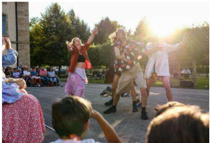
À la tombée du jour, avec une température idéale, toutes les conditions étaient réunies pour un moment réussi.

n'ont pas laissé une minute de répit aux yeux et aux oreilles des amateurs de danse contemporaine présents. Des jeunes, des moins jeunes, des familles... Tous étaient captivés par « Short people », chorégraphié par Bruno Pradet. Le spectacle résonnait avec l'exposition du moment au CNCs, dédiée au chorégraphe Philippe Decouflé.