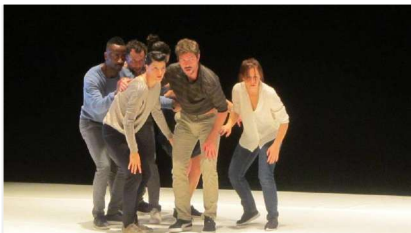
Les sept interprètes de People, what people ?