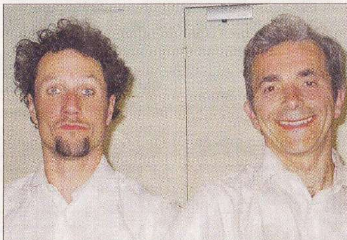
DUO. La compagnie Vilcanota, de Montpellier, a offert un spectacle plein d'originalité et d'énergie.

Le 3 e festival des Printemps de la danse a ouvert ses portes, vendredi, au complexe sportif intercommunal de La Tour-d'Auvergne, avec, en première partie, un film de Bruno Deville, La boule d'or , sur une chorégraphie du Suisse Philippe Saire.