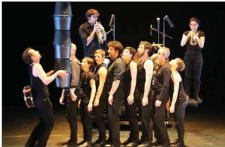
Les artistes poursuivront leur tournée en 2016, puisque seize dates les attendent jusqu'au mois de mai.

C' est cette semaine que "L'homme d'habitude", créé en 2013 à La Nacelle d'Aubergenville (Yvelines), et en grande tournée à travers la France depuis, a été présenté au public de la Rampe. Force est de constater que là aussi, une fois encore, la magie a fonctionné. Plus d'une heure durant, les spectateurs, petits et grands confondus, se sont régalés de ce spectacle inclassable, annoncé comme un concert de danse déconcertant. Ce qualificatif, qui nous avait interpellés ou interrogés avant d'avoir vu le spectacle, est maintenant totalement oublié et remplacé par un autre mot bien plus adapté – observation du public pendant et après le spectacle à l'appui – : "séduisant". En effet, le public a été capté