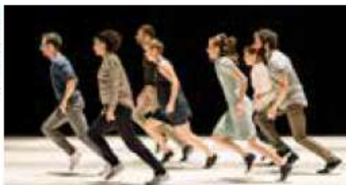
People what people ? de Bruno Pradet.

À la tête de la Compagnie Vilcanota depuis une quinzaine d'années et auteur d'autant de spectacles, Bruno Pradet avait fait forte impression avec L'homme d'habitude , pièce rock concoctée avec la complicité des musiciens des Blérôts de R.A.V.E.L. Avec un humour qui flirte avec la poésie et l'absurde, il n'a de cesse, dans ses créations, de sonder la condition humaine, ses âmes tourmentées, ses désordres, ses beautés, son quotidien. Il revient avec People what people ? , nouvel opus où sept danseurs, unis par les pulsations d'une musique électro ponctuée de fanfares festives ou militaires, évoluent en un groupe imbriqué, compact, qui toujours se disloque pour mieux se recomposer. Une petite humanité en mouvement perpétuel qui, par les battements de sa danse, non loin du rituel et de la transe, hésite entre rires et larmes.