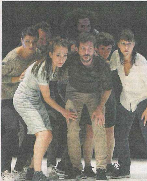
Die Akteure der Compagnie Vilcanota.

Fast wie in Trance mutieren die Akteure zu einer Art kollektivem Über-Individuum, das in wechselnde Zustände gerät. Nach dem langen Part mit seinem stoischen Synkopen-Beat kommt es zu einer ruhigeren Phase. Irgendwann hört die Musik, die sich konsequent aus der elektronischen Avantgarde bedient und zuweilen ethnische Stilizitate einbaut, auf. Phasen-