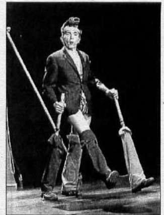
Boby Boy, hier.

► Aujourd'hui, à 18 h 30, au théâtre Christian-Liger, place Hubert-Rouger. Dès 6 ans. Entrée : 6 €. Tél. 04 66 76 10 56.