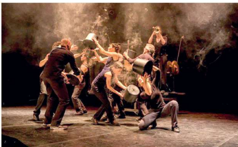
« L'homme d'habitude », une sarabande loufoque et tendre. © Michel Froment