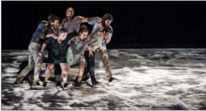
les danseurs forment un chœur qui semble lutter contre un mal invisible.

Dernièrement, l'Espace Rohan de Saverne a accueilli la Compagnie Vilcanota avec « People what people ? », un surprenant spectacle de danse, dynamique et proche du public.